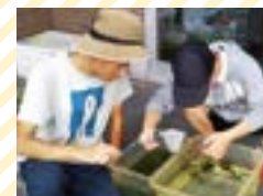
メダカやカブトムシを育成し販売しています。