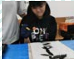
習字や手芸、和紙作りなど