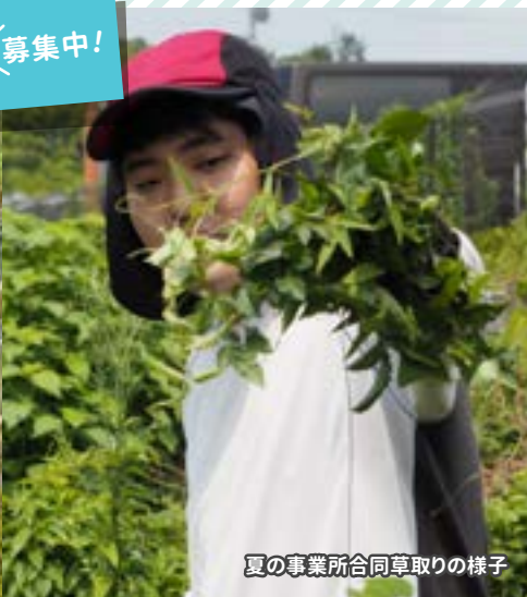
夏の事業所合同草取りの様子

個別支援計画作成にあたっての基本的共通理解として、最近接発達領域を意識し、同時に発達の飛び地を十分に活用することとし、質的な発達のみでなく生活年齢を考慮したヨコへの発達の量的拡大を図れるように十分かつ豊富な手立てを準備します。