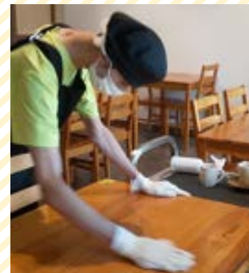
カフェでは接客、清掃、パンの販売、ハーブやいちごを育てています。