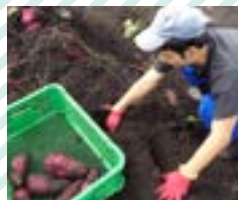
畑で農作業やお茶摘みなど

個別支援計画作成にあたっての基本的共通理解として、最近接発達領域を意識し、同時に発達の飛び地を十分に活用することとし、質的な発達のみでなく生活年齢を考慮したヨコへの発達の量的拡大を図れるように十分かつ豊富な手立てを準備します。