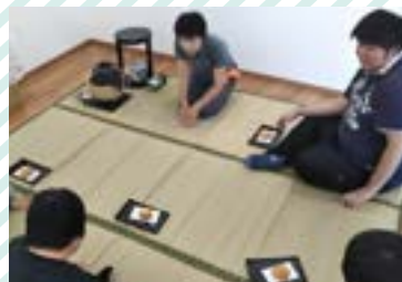
お作法を学びながらのお茶会