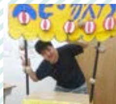
夏祭り、ハロウィン、クリスマスなどイベント多数