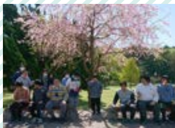
お散歩・体力づくりで公園へ！春はお花見も