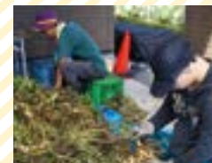
近隣農家の委託作業