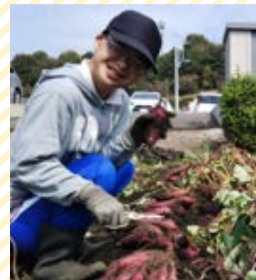
畑で季節のお野菜を育てています。袋詰めし販売したり、カフェで提供しています。

就労継続支援B型では、カフェ作業、農作業など自分にあった作業はもちろん、個々の特性を生かした仕事を創作しています。さまざまな体験の中で成長し、できることを増やしていきます。