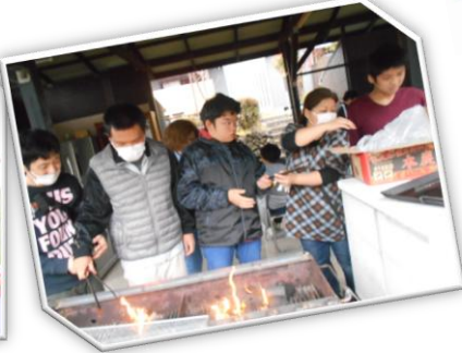
山小屋バーベキュー