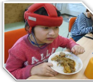
ハンバーグカレー