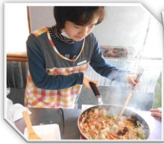
ポロゼーナライス & ポテトのチーズ焼き