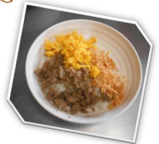
三色丼と卵のすまし汁