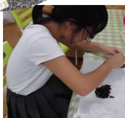
それぞれの取り組みの様子です