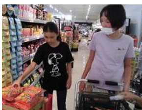
おやつは小学部さんの担当です